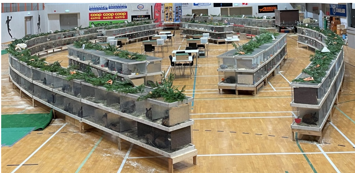
Flott buroppsett med dommerbord i midten